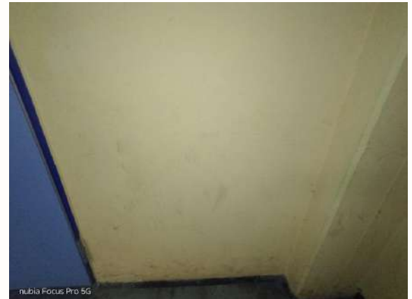
Von Isabella Camilletti

Insgesamt hat die Umfrage gezeigt, dass es sowohl Lob als auch konstruktive Kritik gibt. Wir hoffen, dass diese Rückmeldungen dazu beitragen, unsere Schule weiter zu verbessern.